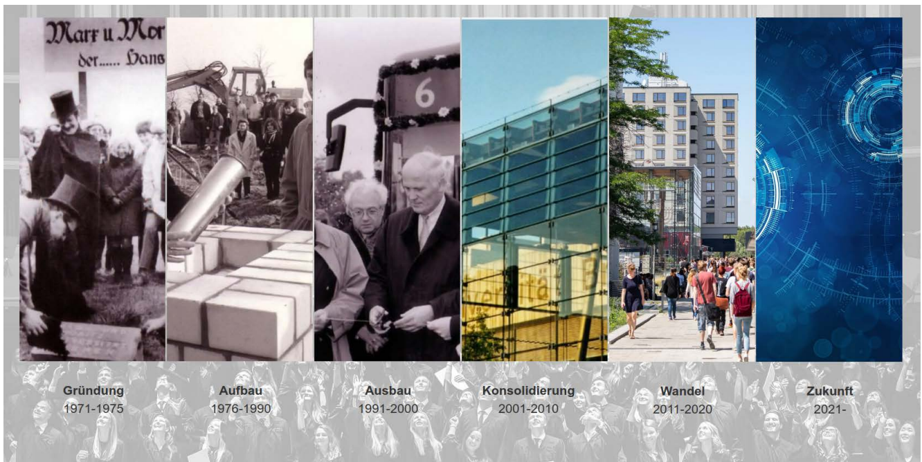
Die Entwicklungsphasen des Fachbereichs Wirtschaftswissenschaft

https://blogs.uni-bremen.de/50jahrewiwi/