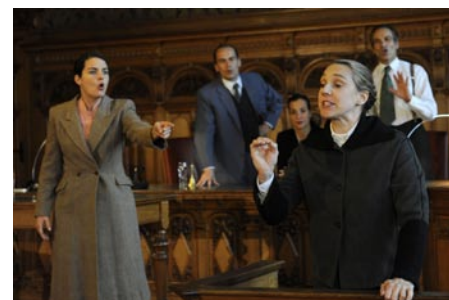
Geschichte erlebbar - das bietet die Veranstaltungsreihe „Aus den Akten auf die Bühne“.