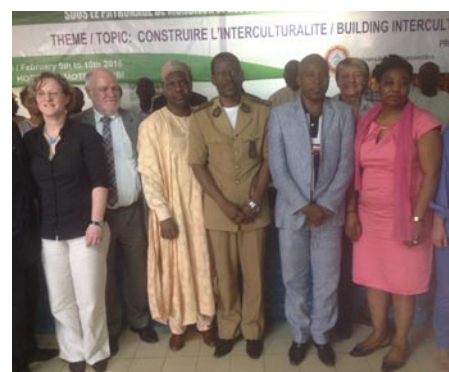
Teilnehmer des Interkulturalität-Workshops in Kamerun

Nach zwei Tagen intensiver Diskussion standen zahlreiche neue Kooperationsansätze auf der Agenda, die von gemeinsamen Forschungsprojekten bis zum Studierendenaustausch reichen und die Kooperation zwischen den Universitäten weiter bereichern werden.