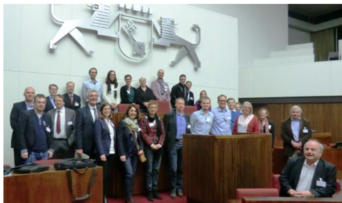
Die Alumni in der Bremer Bürgerschaft

gekennzeichneten Tischen zusammenfinden und dort miteinander ins Gespräch kommen.