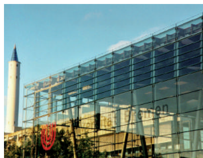
Die Universität Bremen, © Universität Bremen.

Die Uni Bremen ist unter den Gewinnern zur Förderung des wissenschaftlichen Nachwuchses. Die Gemeinsame Wissenschaftskonferenz des Bundes und der Länder (GWK) hat am 21. September 2017, während einer Pressekonferenz in Berlin, die Auswahlergebnisse der ersten Bewilligungsrunde vorgestellt. Ausgewählt wurde nach einem wettbewerblichen Verfahren. Über