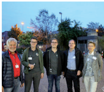
Beim traditionellen Get-Together.

Unser Alumni-Abend klang auch entsprechend fröhlich, launig und interessiert aus beim gemeinsamen Get-together auf dem Betriebs Hof. Eine Mut machende Begegnung, die konkrete Unterstützungsmöglichkeiten bietet. Ein Austausch, der einmal mehr den Campus für Ehemalige lebendig macht. Wir wünschen dem Team viel Erfolg auf ihrem Weg. Wer sich konkret engagieren möchte als Unterstützer, wendet sich bitte direkt an: Ann-Maraïke.Benthien@bremergy.de ./MB