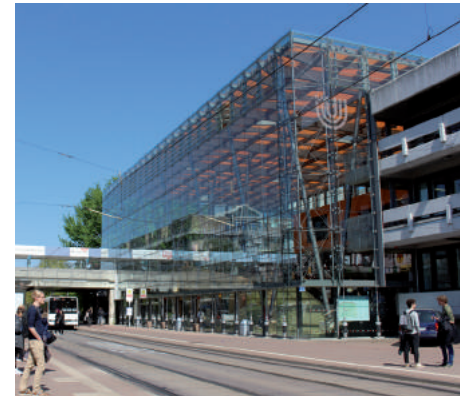
Die Universität Bremen.

„Diesen Fortgang werden wir intensiv unterstützen.“