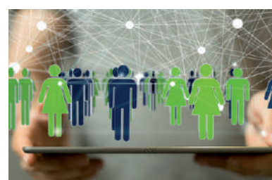
Netzwerken mit Alumni, © vege.

ACHTUNG: Die Teilnahme ist auf 20 Personen begrenzt. Es