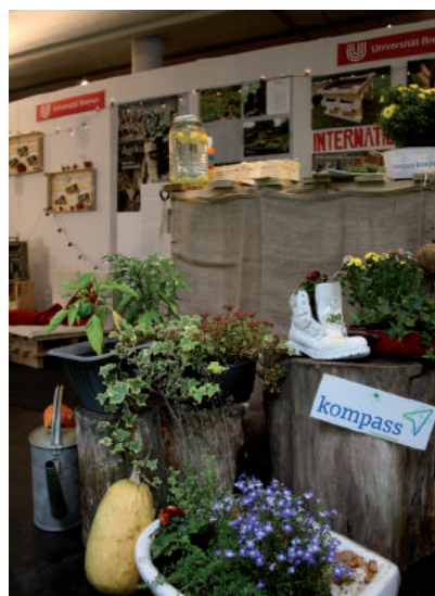
Eigene Kräuter und eigenes Gemüse im Wohnheim, © International Office.

International Urban Gardening - im Studierendenwohnheim Wohnpark Am Fleet und Spittaler Straße - wurde im Laufe des letzten Jahres vom kompass-Team des International Office der Universität Bremen in Kooperation mit dem Studentenwerk und dem Verein Gartenfreunde Bremen e.V. zusammen mit ca. 40