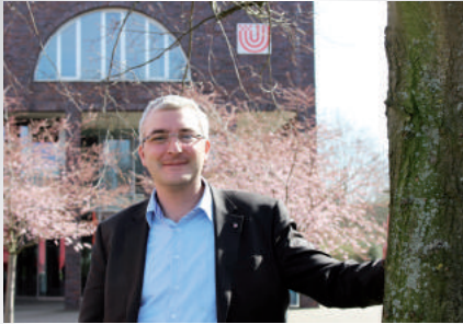
Sehr geehrte Alumni der Universität Bremen,

das Jahr ist schon vorangeschritten, herbstliche Treffen und faszinierende Themen beschäftigen uns in dieser Ausgabe.