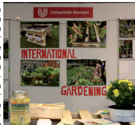
Auf der Hanse-Life-Messe, © International Office.

Studierenden aus dem kompass-Team - den interessierten Besuchern auf der Hanse-Life-Messe erzählt. Diese hörten meist begeistert zu und gingen mit neuen Ideen für ihren eigenen Garten oder ihren Balkon nach Hause: mit Upcycling-Ideen für alte Schuhe, Plastikflaschen oder Waschbecken oder dem unwiderstehlichen Drang, sich sofort ein Palettenbeet aufzubauen.