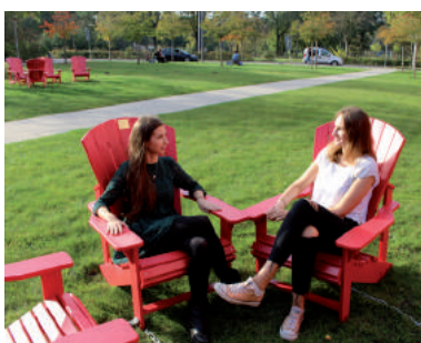
Die Dickinson Chairs sind ein beliebter Treffpunkt.

Der kultige Gartenstuhl mit der bequemen Fächerlehne bekam erneut Zuwachs auf dem Campus. Als Symbol für gelebte Partnerschaft und zur Gestaltung der Universität kann jeder, der sich verbunden fühlt, mit einer Spende von 400 Euro einen persönlichen Dickinson Chair auf dem Campusgelände in Bremen leuchten lassen. Auf