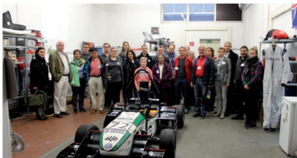
Alumni bei Bremergy.