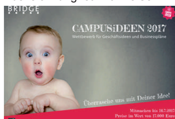
Der Wettbewerb CAMPUSIDEEN, © BRIDGE.

Der Preis wurde in diesem Jahr zum 15. Mal vergeben. In der aktuellen Runde sind Teams der Universität Bremen und des Max-Planck-Institut für Marine Mikrobiologie unter den Gewinnern. Durchgeführt wird der Wettbewerb von der 2002 gegründeten Hochschulinitiative BRIDGE . Mit BRIDGE fördern die Universität Bremen, die Hochschule Bremen, die Hochschule Bremerhaven und die Bremer Aufbau-Bank Existenzgründungen aus Hochschulen. Zu den Angeboten gehören Beratungen zum Thema Selbstständigkeit und ein Kursprogramm./MB