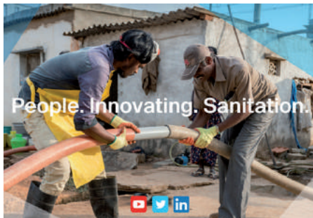
Die Bremen Overseas Research and Development Association, © BORDA.

Seit 1977 gibt es BORDA bereits. Gestartet mit 100.000 D-Mark begann das Projekt als kleiner, entwicklungspolitischer Verein in Bremen. Heute – 40 Jahre später – ist daraus eine der größten,