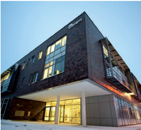
Das MARUM