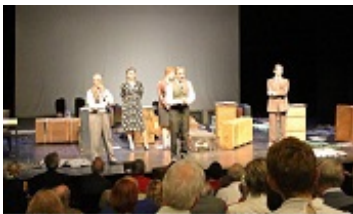
© Alumni der Universität Bremen e.V.