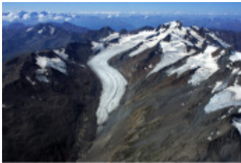
© Institut für Atmosphären- und Kryosphärenwissenschaften, Universität Innsbruck