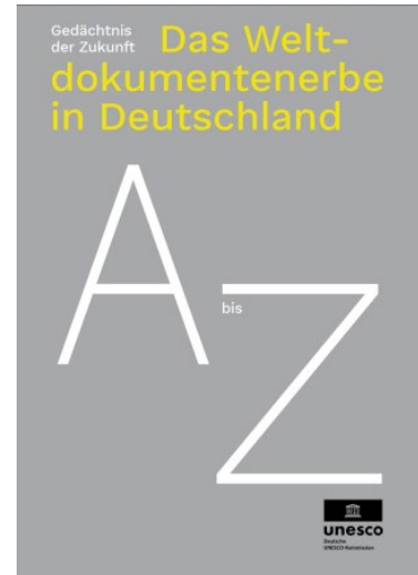
Das Weltdokumentenerbe in Deutschland

Newsletter der Deutschen UNESCO-Kommission Verantwortlich: Timm Nikolaus Schulze Redaktion: Mark Jungbluth