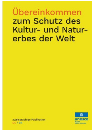
Übereinkommen zum Schutz des Kultur- und Naturerbes der Welt