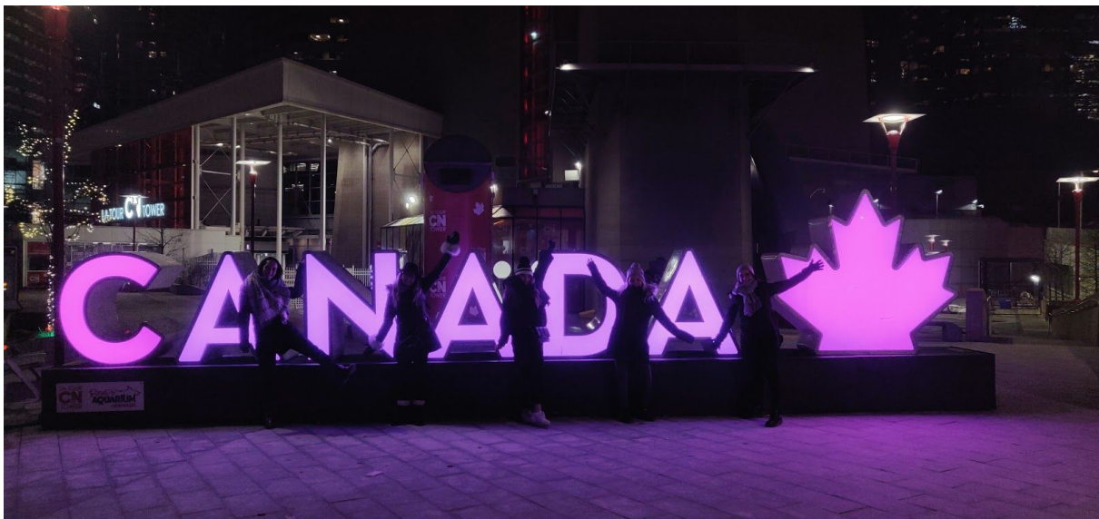
“Canada” Schild beim CN Tower