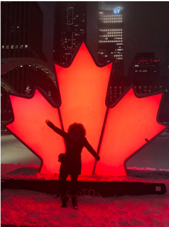
Nathan-Phillips Square Toronto