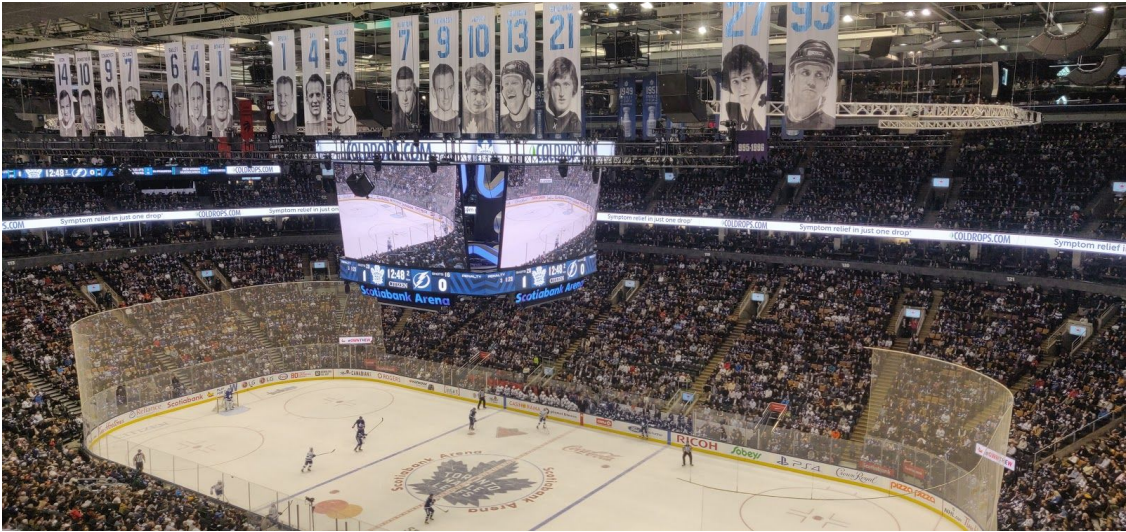
Maple Leafs Spiel in der Scotiabank Arena