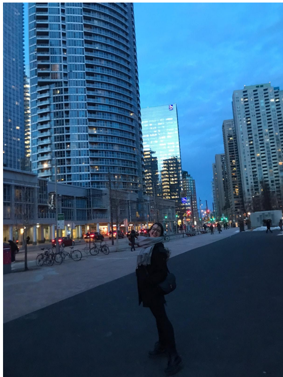
Harbourfront in Downtown Toronto