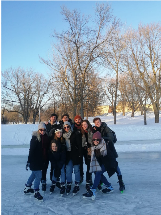
Schlittschuhlaufen in Montréal